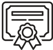
Realna szansa doświadczenia