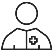
Prywatna opieka medyczna