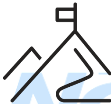
Dofinansowanie do odpoczynku