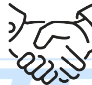
Koleżeńska atmosfera w pracy